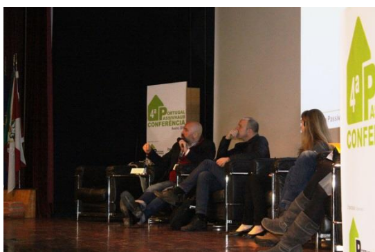
A Sessão 1 SABER – discussão