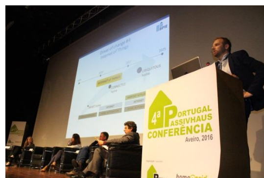
A Sessão 3 INOVAR – apresentação de Maarten De Groot