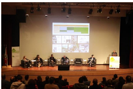
A sessão plenária