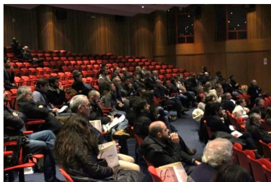
A audiência da Conferência