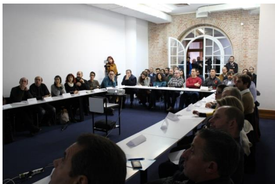
O Workshop "Envolvente do edifício"

Decorreu nos dias 24 e 25 de Novembro de 2016, no Centro Cultural e de Congressos de Aveiro, a 4ª Conferência Passivhaus Portugal 2016 com a organização da Associação Passivhaus Portugal e da Homegrid. No dia 24 de Novembro, quinta-feira, decorreram 2 workshops Passive House e no dia 25, sexta-feira, tiveram lugar as quatro sessões da conferência. A exposição de produtos e soluções adequadas à Passive House ocorreu em ambos os dias com a participação de mais de 30 empresas. Esta quarta edição da conferência contou com mais de 200 participantes, estando já marcada a quinta edição no próximo ano.