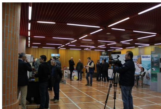
A exposição com mais de 30 empresas