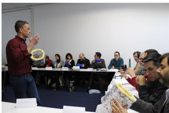
O Workshop “Sistemas e Equipamentos” com a presença de 40 participantes.