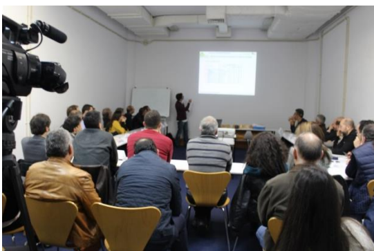
O Workshop “Envolvente do Edifício” com a presença de 40 participantes.