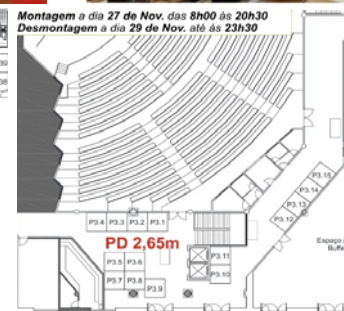
Planta do 2º andar