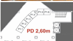
Altura do r/chão