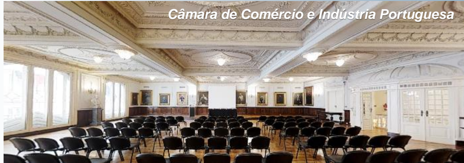
Câmara de Comércio e Indústria Portuguesa