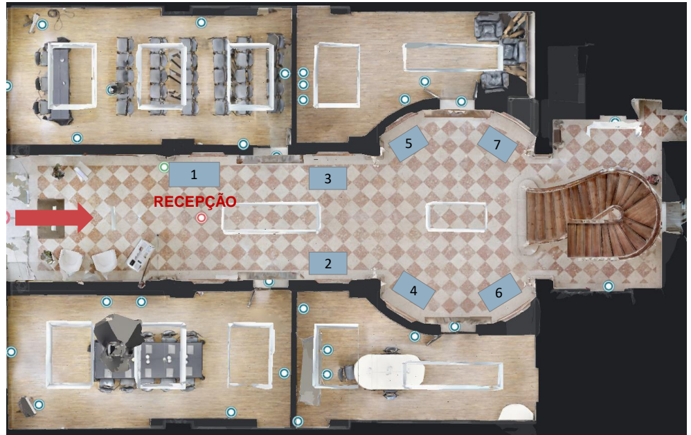
Rés do Chão