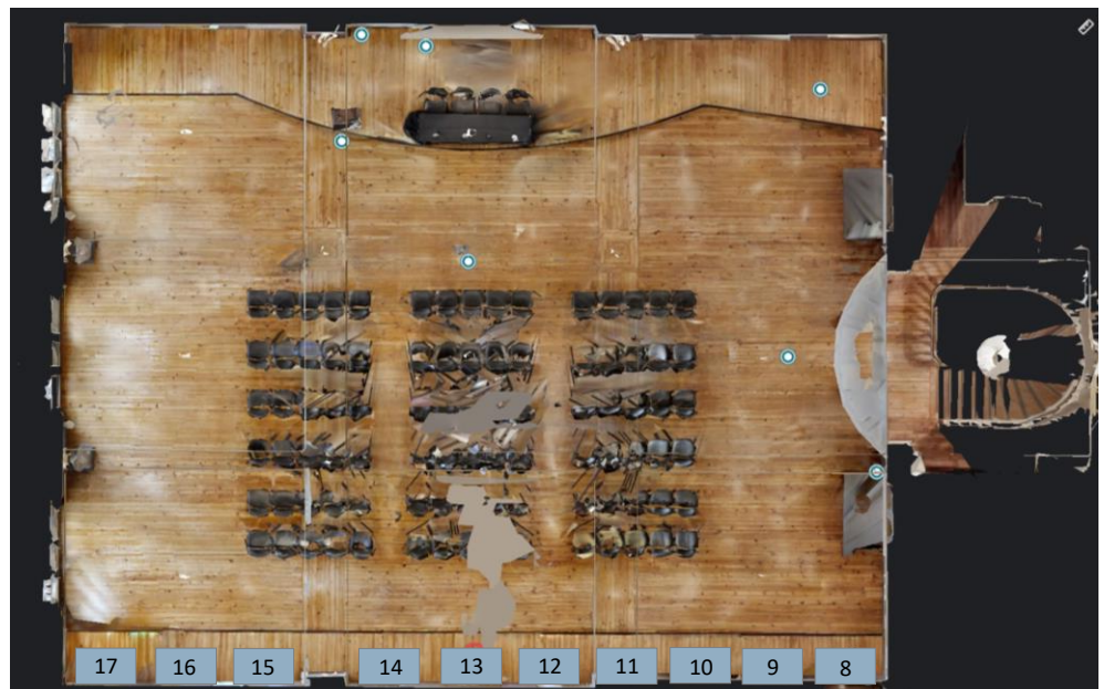
1º andar – Salão Nobre D.Maria II

Todos os stands têm um espaço de 1,50m x 1,00m